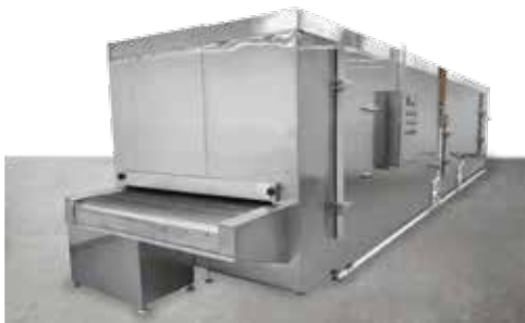
Túnel de congelación