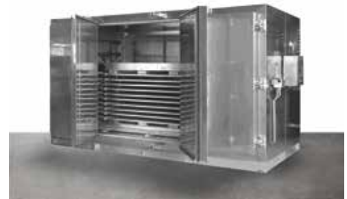
Armarios de congelación en bloques