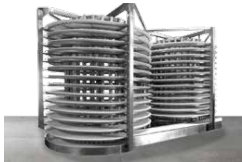
Espiral de congelación